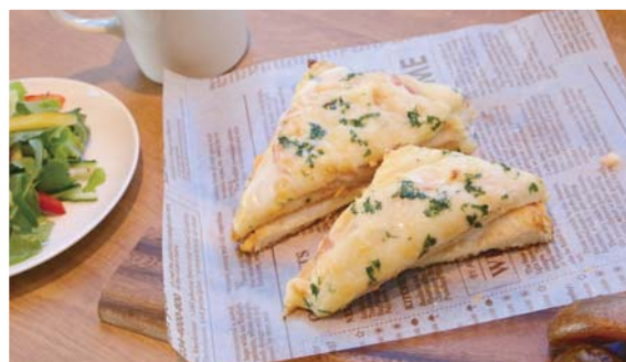
チーズのクロックムッシュ風サンド トリュフの香り

Cheese sandwich croque monsieur style truffle flavor