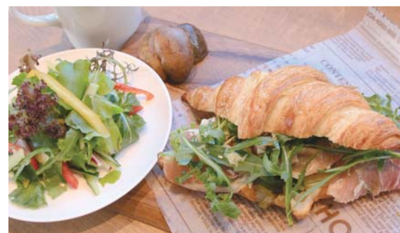
生ハム、ルーコラ、パルミジャーノの クロワッサンサンド

Sand wich of basil flavor chicken and tomato country style