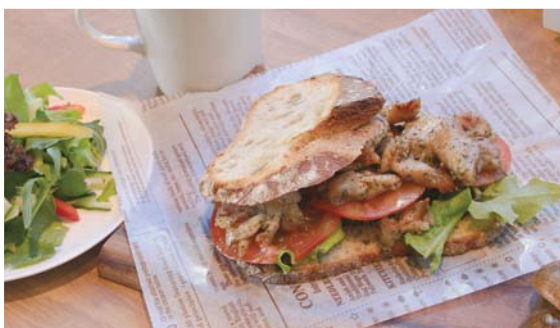
鶏ももバジルとトマトの カンパニョサンド

Cheese sandwich croque monsieur style truffle flavor